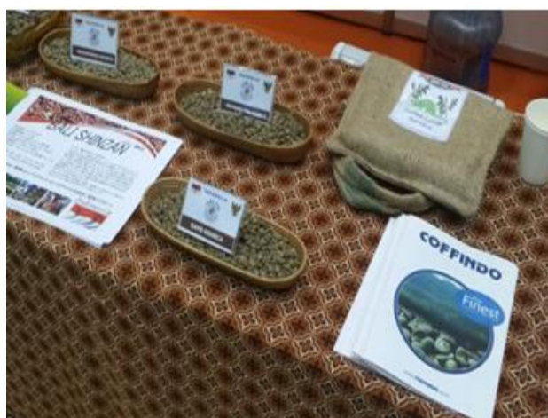
Suasana & aktivitas display pameran di stan KBRI Tokyo / GAEKI.